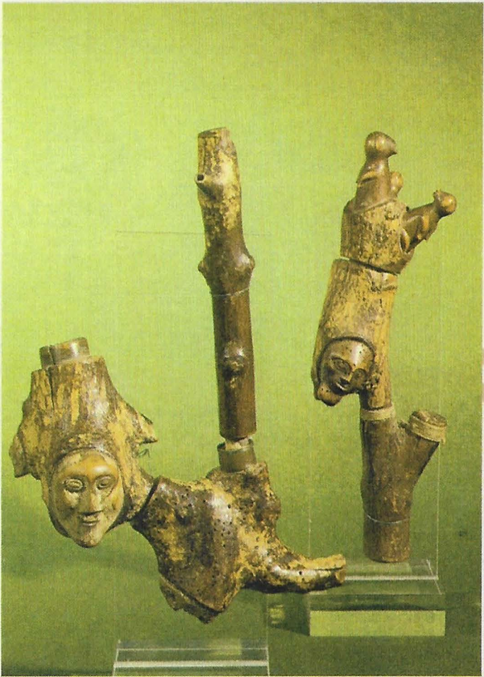
Oudste pijp in Europa. Rozenhoutpijpen van de Hertog van Braunschweig, 1602. Österr. Tabak Museum Mariahilfer Strasse 2, Wien. Nr. 5046. (Zie artikel "Oostenrijks Tabaksmuseum")