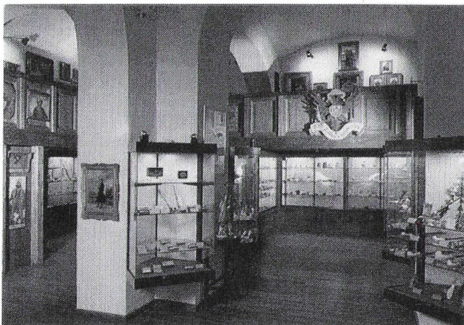
Tabakkantoor en galerij. Österr. Tabak Museum Mariahilfer Strasse 2, Wien. Nr. 5049.