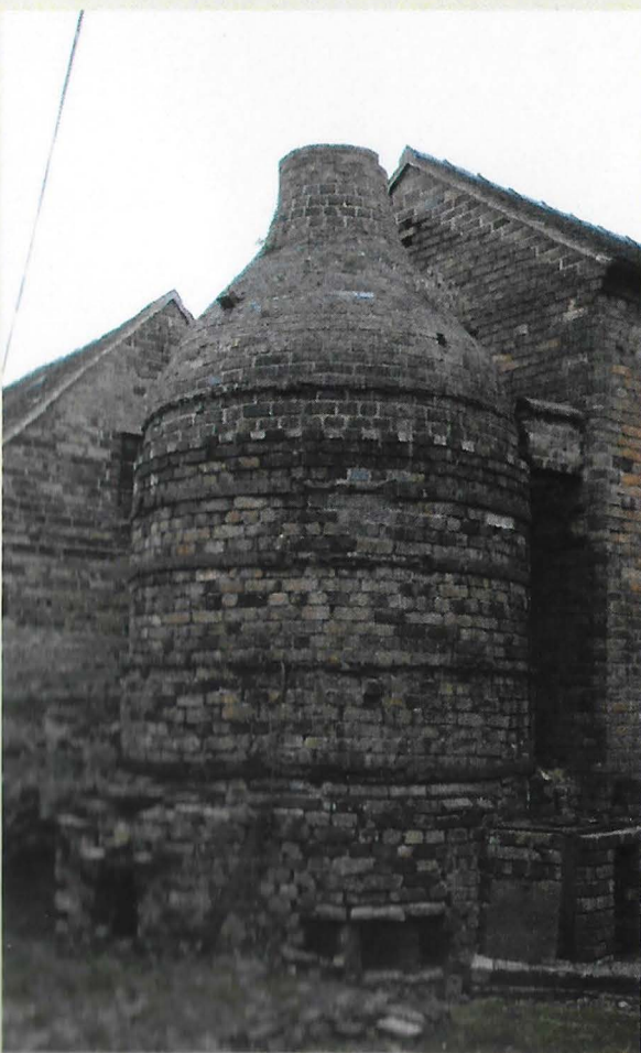
Op de foto links de pijpenoven van de voormalige fabriek en op de foto hieronder de achterzijde van het complex (zie art. Broseley Pipeworks Clay Tobacco pipe Museum)