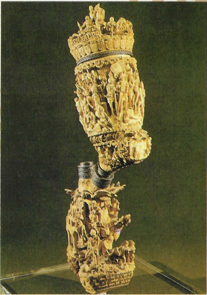
Reuzenpijp. „Wiener Jagdausstellung 1910“. Österr. Tabak Museum Mariahilfer Strasse 2, Wien. Nr. 5048. (Zie artikel "Oostenrijks Tabaksmuseum")