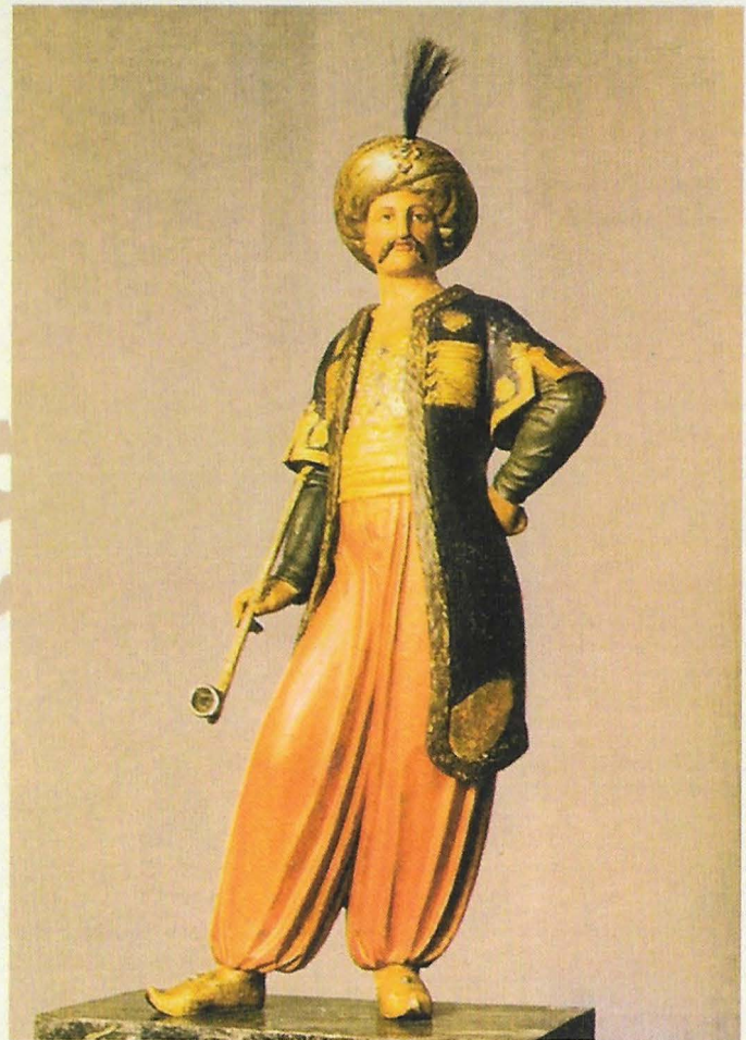
Houten beeld van een man in Oosterse kleding (Wenen, 18e eeuw). Österr. Tabak Museum Mariahilfer Strasse 2, Wien. Nr. 5042. (Zie artikel "Oostenrijks Tabaksmuseum")

Twee detail opnames van de Gouwenaren een het plafond van Keens. In total hanger er zo'n 5000 van deze pijpen aan het plafond, slechts een tiende van wat het steakhouse per 3 jaar inkocht. Meer foto's zijn te zien op de website www.keens.com . (zie artikel "pjpelogie in New York")