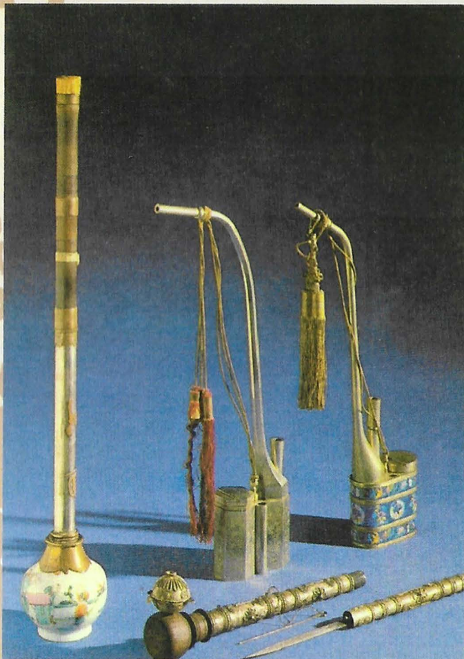
Chinese opiumpijp en Thailandse zilveren pijp met dolk. Österr. Tabak Museum Mariahilfer Strasse 2, Wien. Nr. 5044. Op de achtergrond staan twee Chinese waterpijpen, die niet op de kaart vermeld zijn. (Zie artikel "Oostenrijks Tabaksmuseum")